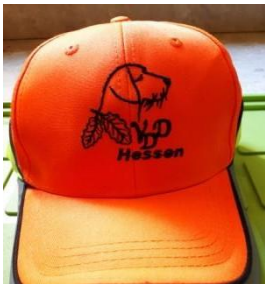
DJ Cap 19,00 Euro