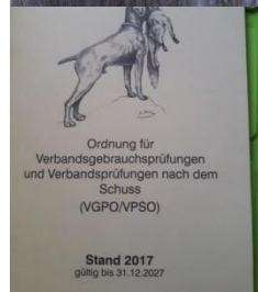
VGPO 9,80 Euro