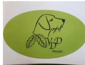
Aufkleber Oval 3,00 Euro

All unsere Shop Artikel können Sie auf unseren Veranstaltungen und Prüfungen erwerben, oder bei unserer Geschäftsführerin bestellen.