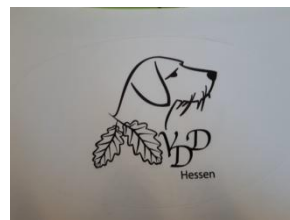
Aufkleber oval 3,00 Euro