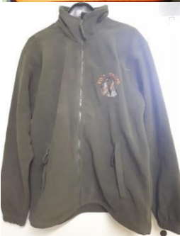
Fleece Jacke in S, M, L, XL mit braunschimmel oder schwarzsimmel DD