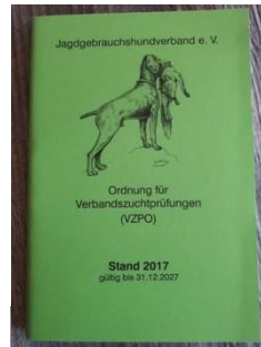
VZPO 6,80 Euro