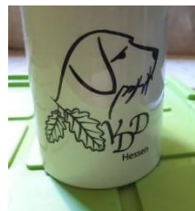
Tasse 9,80 Euro