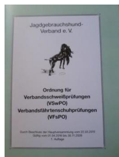
VSwPO 12,90 Euro