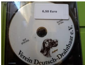
DD DVD 6,80 Euro