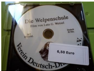
DVD 6,80 Euro