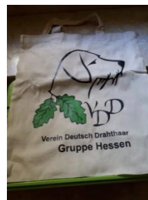
Tasche 3,00 Euro